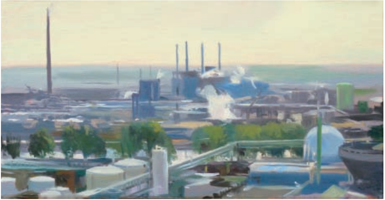
Till Warwas Industriepark Höchst, Blick nach Süden, 2010 Öl auf Leinwand 31 x 60 cm