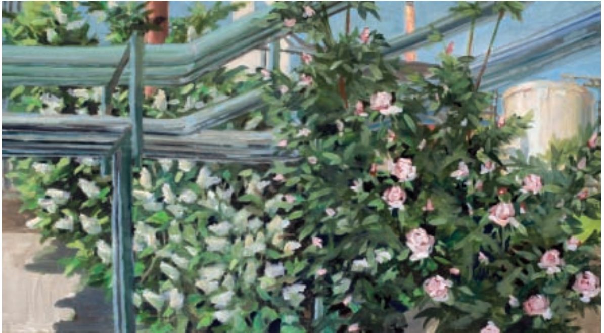
Sigurd Wendland Tank, 2010 Öl auf Leinwand 55 x 100 cm