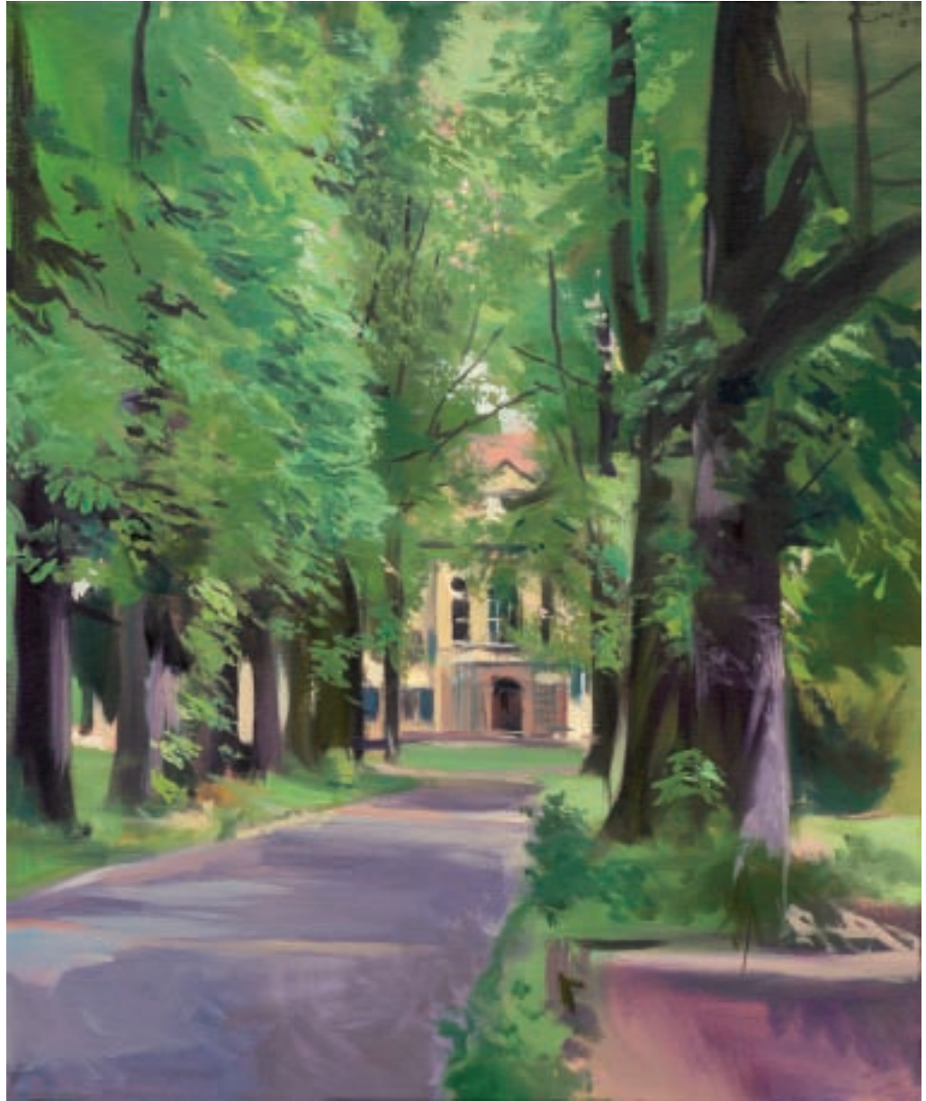
Till Warwas Sindlinger Kastanienallee, Meisterville, 2010 Öl auf Leinwand 60 x 50 cm