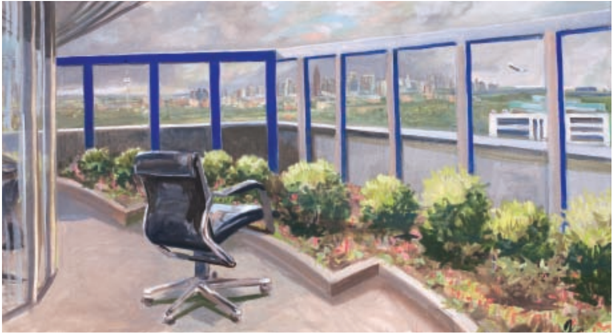
Sigurd Wendland Chefsessel, F 821, 2010 Öl auf Leinwand 65 x 120 cm