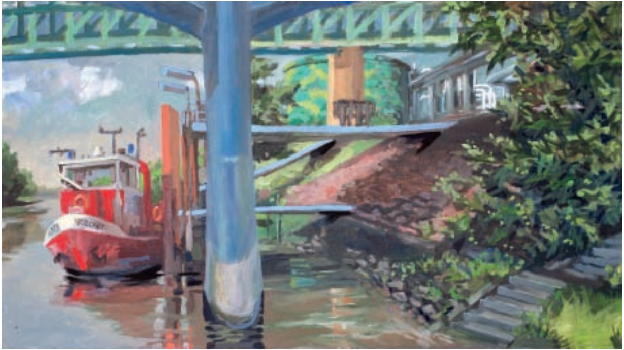
Sigurd Wendland Feuerwehrboot, an der Mittelbrücke, 2010 Öl auf Leinwand 55 x 100 cm