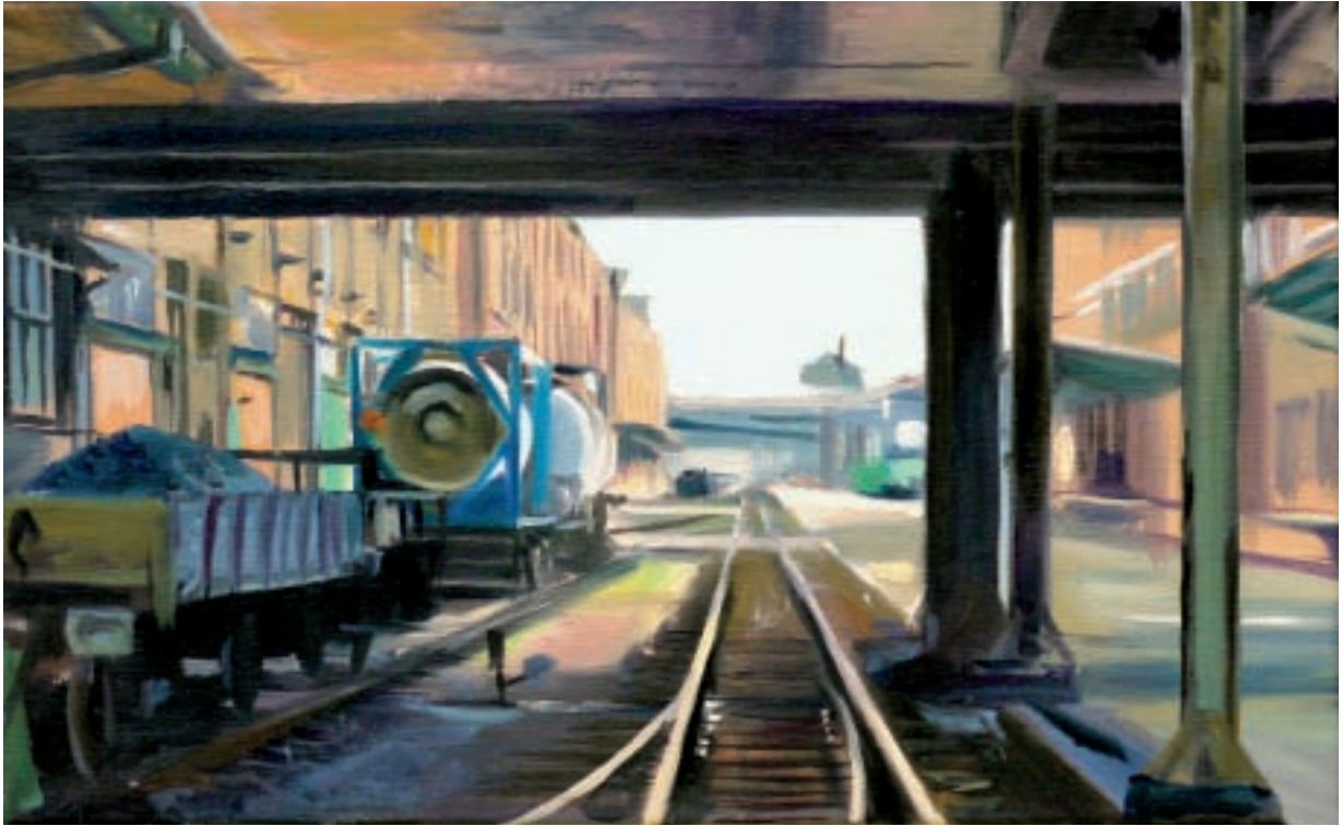
v Till Warwas Industriepark Höchst, im Hafen, 2010 Öl auf Leinwand 31 x 50 cm