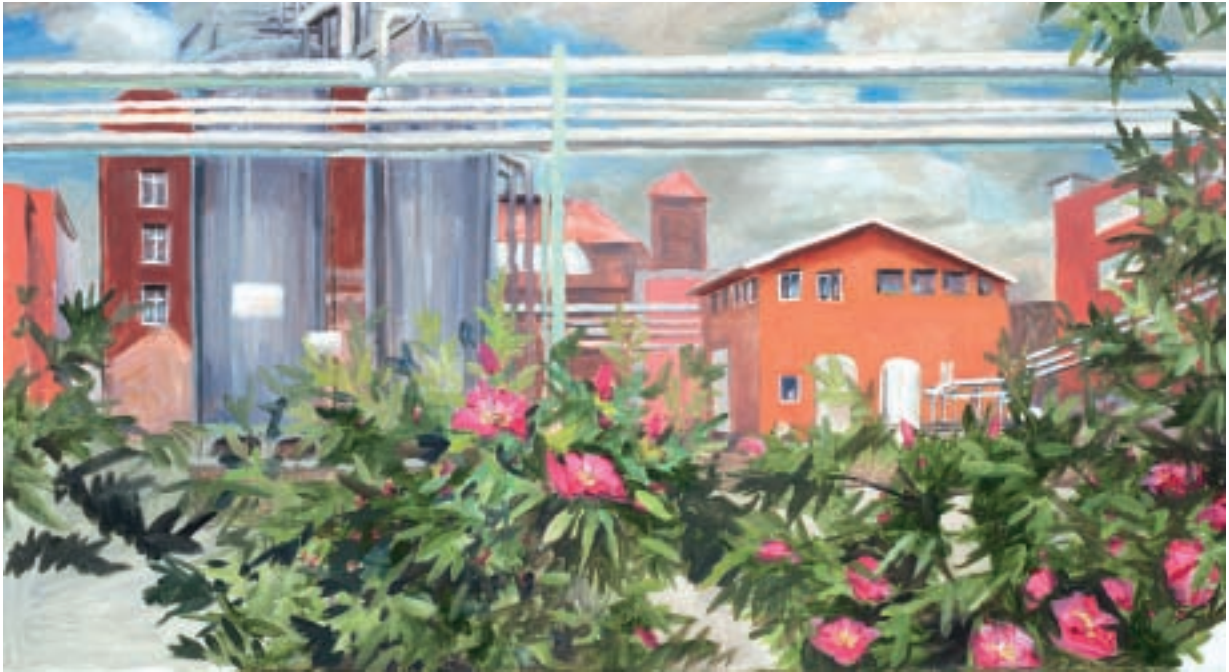
Sigurd Wendland Rohre, 2010 Öl auf Leinwand 65 x 120 cm