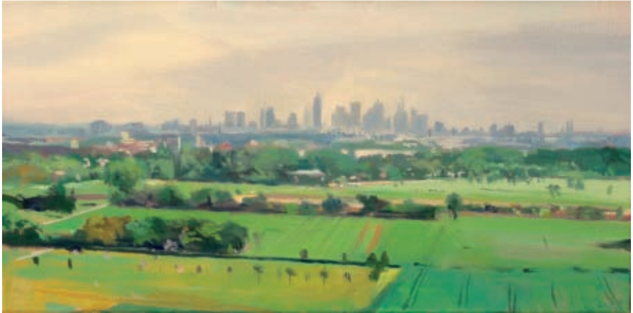
Till Warwas Blick auf Frankfurt am Main, 2010 Öl auf Leinwand 30 x 60 cm