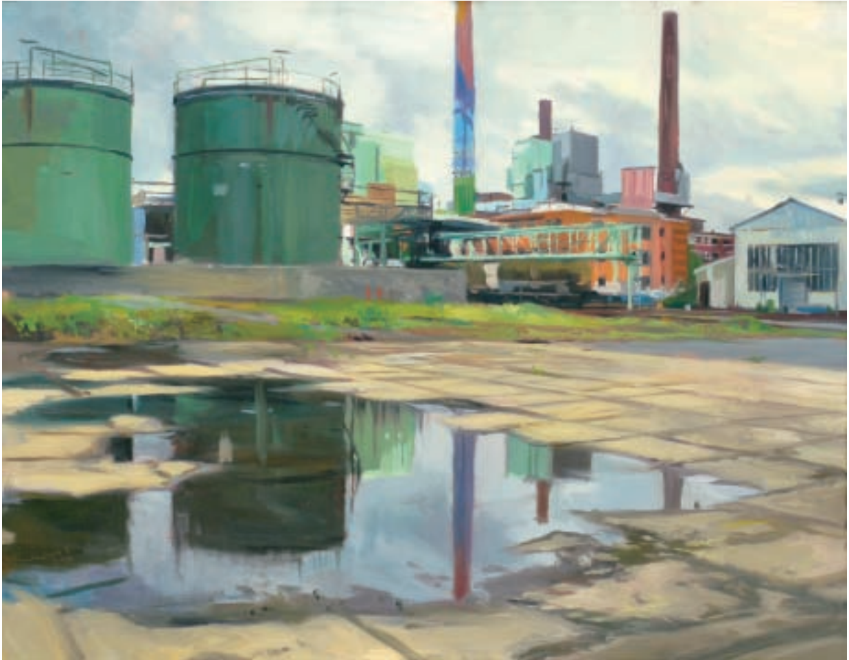
Till Warwas Industriepark Höchst, Am Kraftwerk, 2010 Öl auf Leinwand 70 x 90 cm