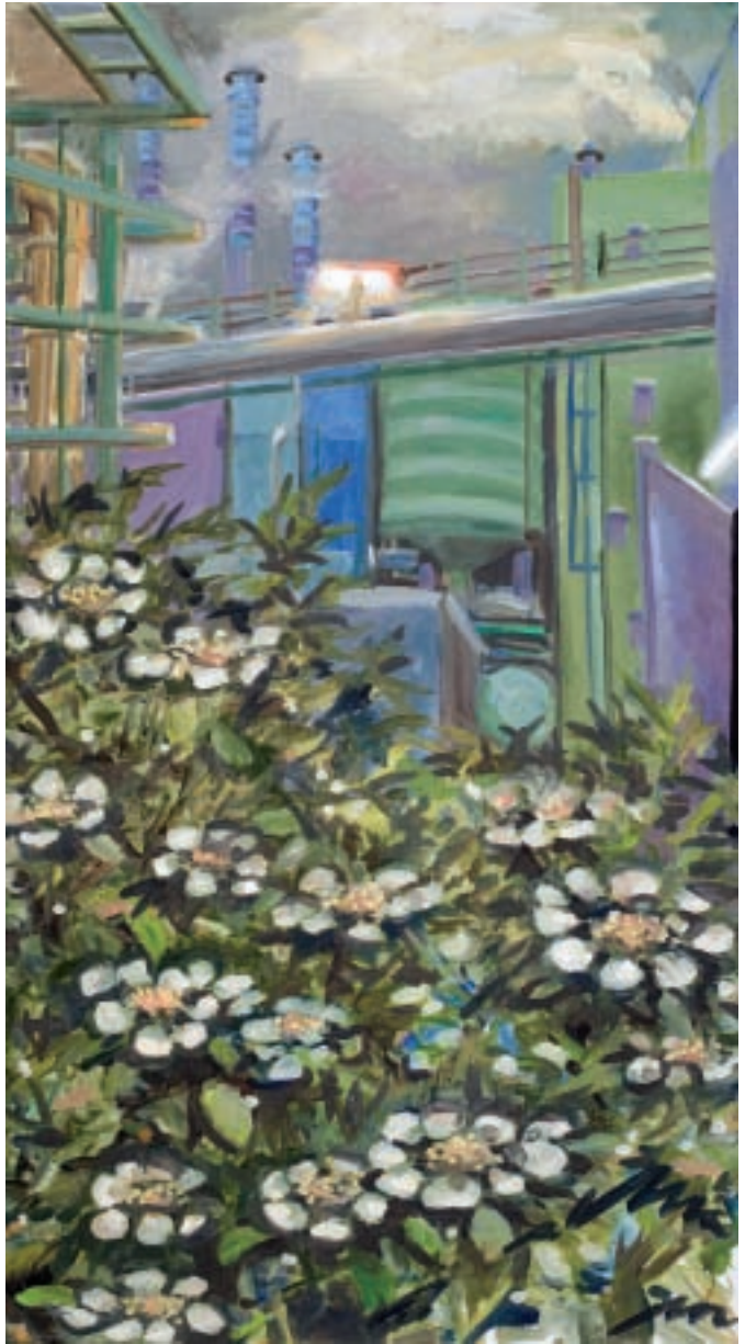
Sigurd Wendland Ersatzbrennstoffanlage, 2010 Öl auf Leinwand 120 x 65 cm