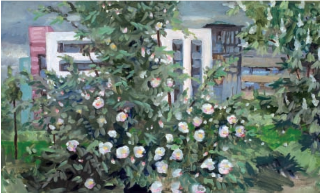
Sigurd Wendland Multifunktionslabor, G 878, 2010 Öl auf Leinwand 50 x 70 cm