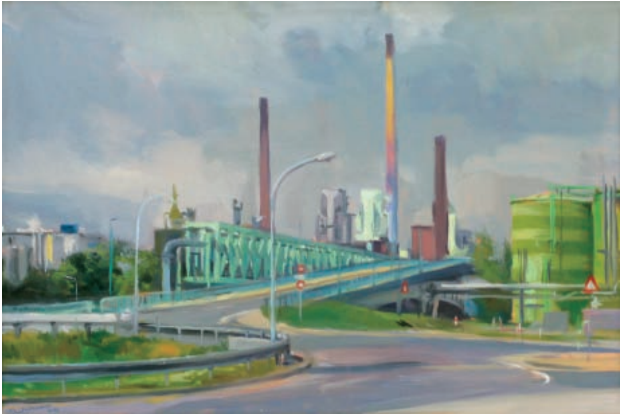
Till Warwas Industriepark Höchst an der Mainbrücke, 2010 Öl auf Leinwand 40 x 60 cm