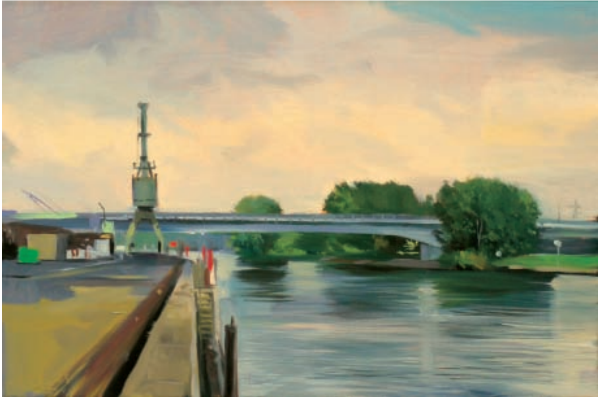
Till Warwas Industriepark Höchst, Leunabrücke, 2010 Öl auf Leinwand 40 x 60 cm